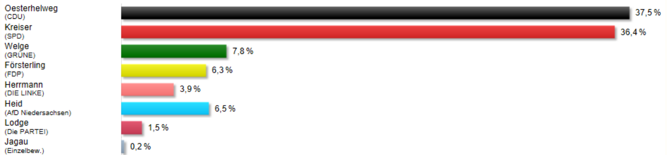
Abbildung 5 Ergebnis Landtagswahl im Stimmbezirk Sickinge 2

(Gemeinde Sickinge, Samtgemeinde Sickinge insgesamt, Wahlkreis 9 insgesamt)